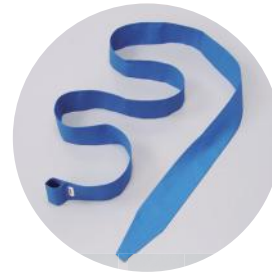
駅用タスキとしてもご利用頂けます。