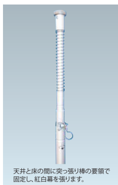
天井と床の間に突っ張り棒の要領で固定し、紅白幕を張ります。